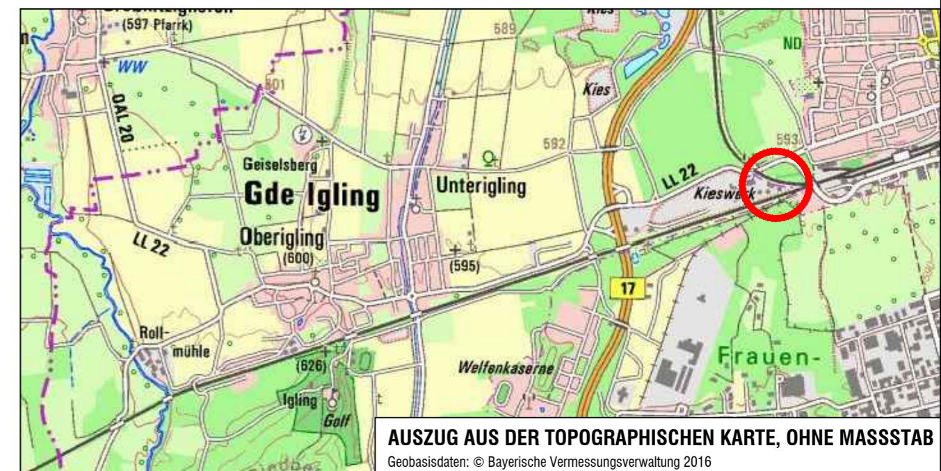
AUSZUG AUS DER TOPOGRAPHISCHEN KARTE, OHNE MASSSTAB