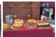
leckere Kuchen und Kaffee

Weitere Informationen finden Sie auf unserer Homepage: