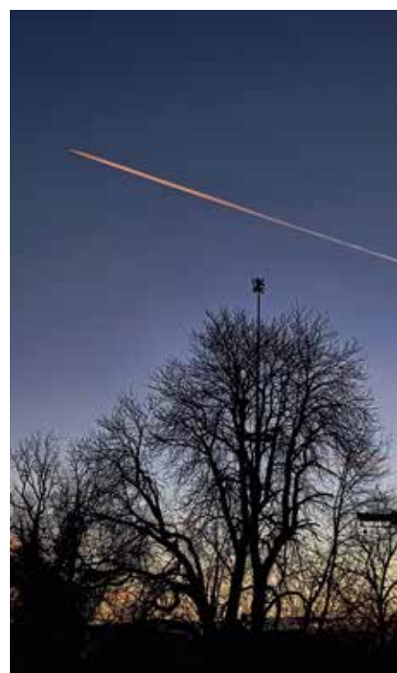
Sonnenaufgang am Ostersonntag