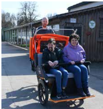
Die Rikscha ist „das Highlight“, wie eine Mitarbeiterin sagte; Fahrer und Passagiere genießen die Tour – erst noch etwas vorsichtig, aber dann voller Freude!