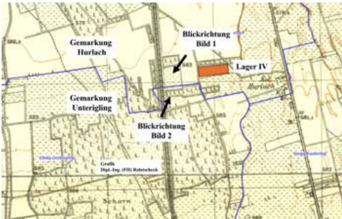
Flurgrenzen im Bereich des Lagers IV und dem Angriff am 25. April 1945

Am 24. April 1945 mussten sich die Häftlinge aus Lager IV, dem Todes- bzw. Krankenlager, diesem Marsch ebenso anschließen. Nur die schwachen, nicht gehfähigen blieben im Lager zurück. Zur Evakuierung dieser Häftlinge mittels Zugtransport durchschnitt man in der Nacht vom 24. auf den 25. April den Zaun des Lagers an der Westseite und die Häftlinge mussten sich unter Bewachung einer Postenkette ca. 500 m bis zur Bahnlinie begeben. Vor den Gleisen mussten die entkräfteten Häftlinge warten bis im Morgengrauen der Zug ankam.