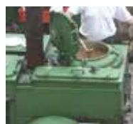
Gulaschkanone in Aktion