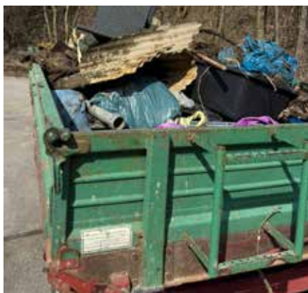
Einer von vielen Wagen

Ich danke allen, die den Müll auflesen, den andere einfach so in die Natur werfen. Mit der Brotzeit danken wir als Gemeinde für dieses Engagement. Sie soll nach dem Sammeln auch dazu dienen, die Gemeinschaft zu pflegen und über das Erlebte zu diskutieren.