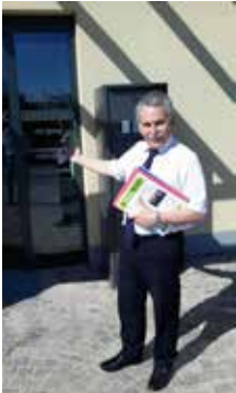
Bürgermeister Günter Först