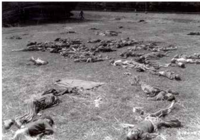
Die Wiese westlich des Lagers an den Bahngleisen, aufgenommen nach der Befreiung durch US-Truppen ca. 28. April 1945.

treffen. Wir stiegen in die Waggons, aber lange nicht alle konnten hinein. Fast als letzter kam ich halb hereingezogen, halb von draußen nachge-