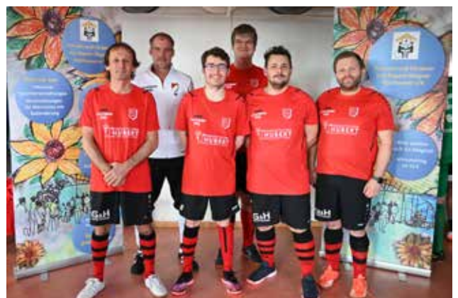
Mannschaftsfoto AH SV Igling