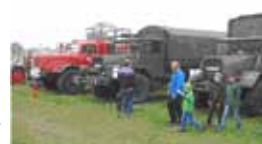
und als Highlight die Präsentation historischer Bundeswehrfahrzeuge