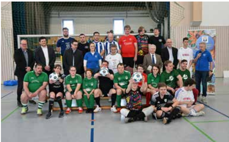
Gruppenbild (Details siehe Text oben)