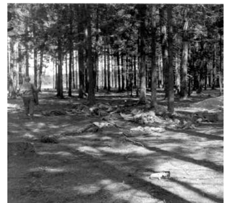
Der Wald südlich der Wiese, aufgenommen nach der Befreiung durch US-Truppen ca. 28. April 1945.