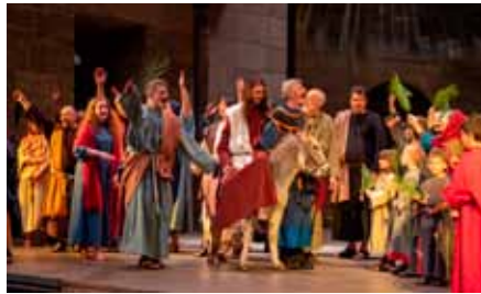
Einzug in Jerusalem

Die Aufführungen (Termine: 16.09., 17.09., 23.09., 24.09., 30.09., 01.10., 07.10. und 08.10.) beginnen samstags jeweils um 18.00 Uhr, sonntags jeweils um 13.30 Uhr und dauern mit Pause dreieinhalb Stunden. Cool ist, dass für Besucher unter 30 Jahren die Tickets nur die Hälfte kosten.