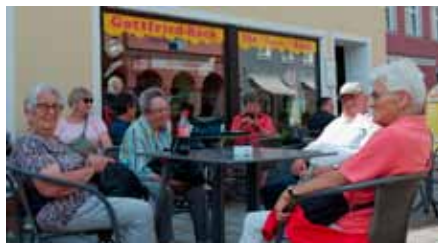
Eine gemütliche Rast bringt verbrauchte Energie zurück

Schön angelegte Spazierwege rund um die Stadt konnten zum entspannten Spaziergang genutzt werden.