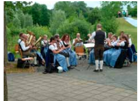
Die Musikkapelle Holzhausen umrahmt den Auftakt-Gottesdienst musikalisch