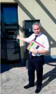
Bürgermeister Günter Först