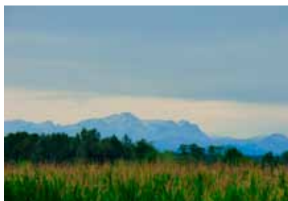
Weinbergschnecke, Weite Berge