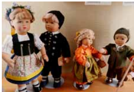
Puppen aus dem Käthe-Kruse- Puppen-Museum

Um 11:00 Uhr öffnete das Käthe-Kruse-Puppenmuseum seine Pforten. Über 150 Puppen, Schaufensterfiguren und Puppenstubenpuppen aus der weltbekannten Manufaktur der Käthe Kruse Puppen von den Anfängen um 1910 bis heute konnten besichtigt werden. Auch um 11:00 Uhr ertönte vom Rathaus das Donauwörther Glockenspiel unter anderem mit dem Lied „üb immer Treu und Redlichkeit“.