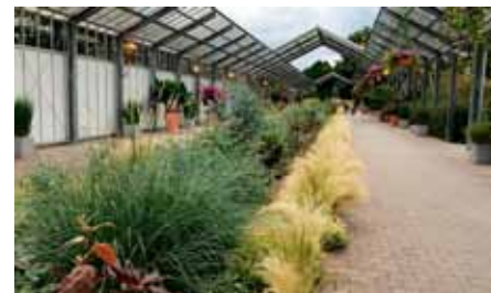
Gartencenter Dehner mit Blick auf den Park

toll angelegte Park mit einem Schau- und Naturlehrgarten in denen Pflanzen aller Art sowie einige Teiche zu