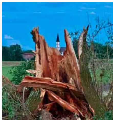
Die alte große Eiche am Geiselsberg/Altbach hat die Sturmnacht vom 11. Juli leider nicht überlebt.