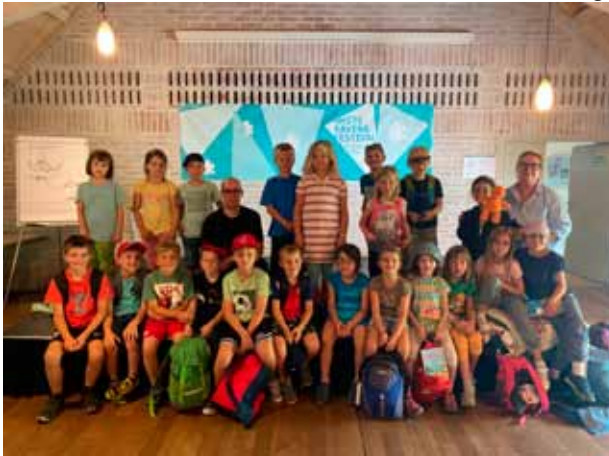
Die Klasse 1a mit Ingo Siegner, dem Autor und Illustrator des kleinen Drachen Kokosnuss

Er malte an einem großen Board, beschrieb seine Zeichenversuche