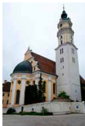
Klosterkirche Heilig Kreuz

Nachdem am Vortag nach großer Hitze ein schweres Unwetter Igling heimsuchte, fuhr der Seniorenclub am Mittwoch den 12. Juli bei gemäßigten Temperaturen nach Donauwörth. Bereits um 10:00 Uhr erreichten wir die Donaustadt, an der die Wörnitz und die Donau zusammenfließen. Im Zentrum, vor dem Liebfrauenmünster konnten wir aussteigen.