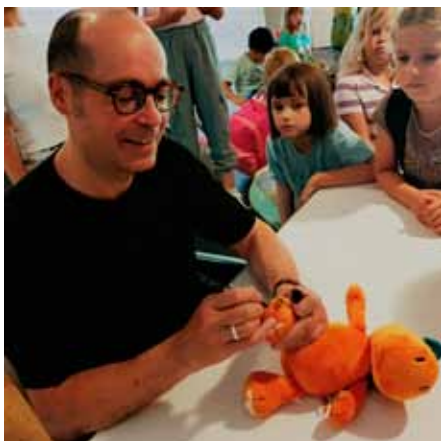
Unser Klassendrache Kokosnuss bekommt ein Autogramm von seinem Erfinder- Papa auf die Fußsohle geschrieben.

Die Lesung begann um 11 Uhr. Ingo Siegner stellte sich, seine Figuren