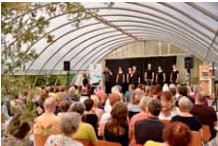
Viel zu lachen gibt es mit den ImproL-Letten aus Landsberg

Ende Juni fand bei Regens Wagner Holzhausen die Sommer-Edition von „Kultur im Gewächshaus“ statt. Eingeladen waren die ImproLLetten, ein Improvisationstheater aus Landsberg am Lech.