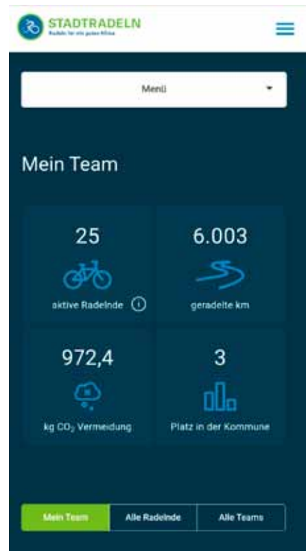
Texte und Fotos: Christoph Dietzinger