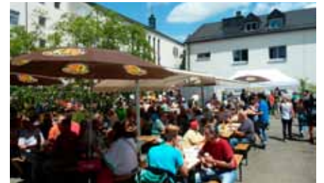
Die Gäste fühlen sich wohl und genießen die super Atmosphäre und das leckere Essen

Was genau war geboten? Traumhaftes Sommerfest-Wetter. Dafür danken wir dem Himmel! Geboten war ein abwechslungsreiches Programm, das mit Altbewährtem, aber auch ganz neuen Attraktionen aufwartete.