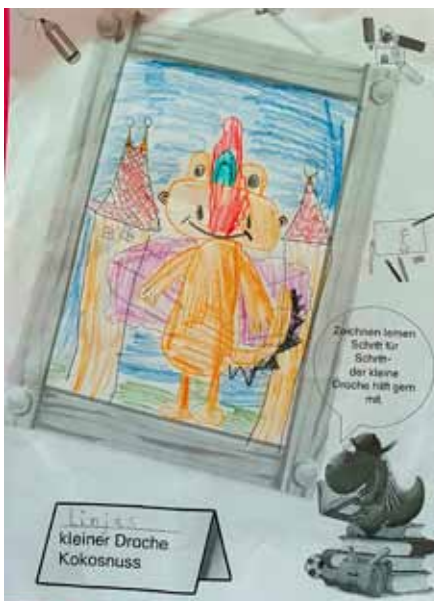
Drache Kokosnuss vor Schloss Blütenburg

Begleitet wurde die Lesung mit zahlreichen Bildern aus diesem Werk. Herr Siegner schaffte es problemlos, die Kinderschar mit verstellter Stimme beim Vorlesen in den Bann zu ziehen. So manch einer fühlte sich sicher in die Drachenritterzeit zurückversetzt. Im Anschluss konnte man noch Bücher kaufen und alle vorhandenen Bücher signieren lassen. Da die 1a so geduldig wartete, durften wir uns als letzte verbliebene Klasse noch mit Ingo Siegner persönlich fotografieren lassen.