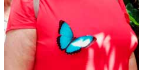
Der Schmetterling hatte keine Scheu

er ein Glücksschwein aus Glas fertigte, etwas über seinen Werdegang zum Glasbläser erzählte. An einer 2000 Grad heißen Flamme bearbeitete er das Glas und formt dabei kleine Kunstwerke von der Christbaum-