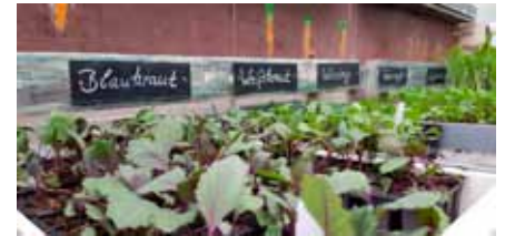
Beim Jungpflanzenverkauf der Bioland-Gärtnerei von Regens Wagner Holzhausen gibt es kräftige Jungpflanzen von Gemüse, Salaten und Kräutern

Wir halten in der Bioland-Gärtnerei eine große Auswahl an Jungpflanzen in Bioland-Qualität für Ihren Garten bereit. Fachliche Tipps gibt es gratis dazu. Zeitgleich veranstalten wir wieder ein Hoffest auf dem Magnushof, mit allem, was dazugehört: Kreativangebot für Kinder, Öffnung des Kleintierbereichs, Live-Musik, Führungen ... und vieles mehr. Natürlich darf auch ein reichhaltiges Angebot an Speisen (in Bio-Qualität) und Getränken inklusive Kaffee und Kuchen nicht fehlen. Bitte beachten Sie: Die Veranstaltung findet heuer samstags statt und dauert bis 18 Uhr.