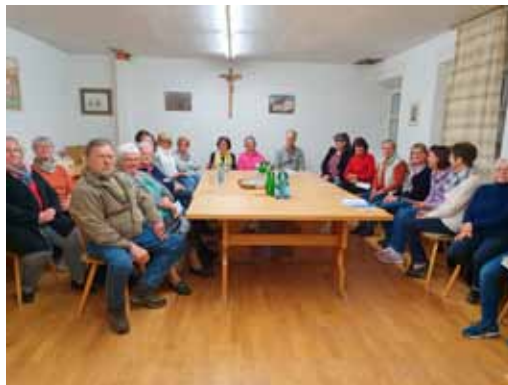
Viele Iglinger holten sich Tipps zum Thema „Strom sparen im Haushalt“

hoffen sehr, dass die TeilnehmerInnen die Tipps umsetzen und somit