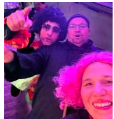
Die Vorstände des Faschingsvereins blicken auf einen tollen Fasching 2023 zurück

wieder sauber wird. Es war wirklich beeindruckend zu sehen, wie es überall gewuselt hat. Das hat uns als Faschingsverein sehr gefreut. Jetzt noch ein kleiner Ausblick zum Thema wann der nächste Umzug stattfindet. Aktuell wissen wir das leider noch nicht. Bei unserer Mitgliederversammlung am 31. März 2023 war der Tenor eher für 2024. Somit würde man nicht wieder mit Münsterhausen