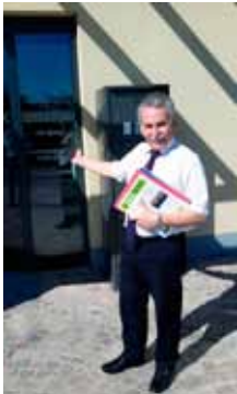
Bürgermeister Günter Först