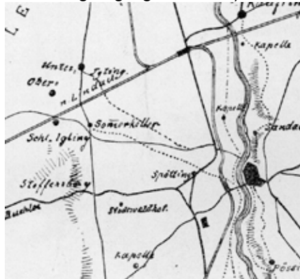
Ausschnitt aus der von C. Fischer gezeichneten Karte

Ueber die Sandauerbrücke und die Eisenbahn, dann ein kleines Stück auf der Augsburger Chaussee, und nun links in das Seitensträßchen (= die heutige Iglinger Straße) einbie-