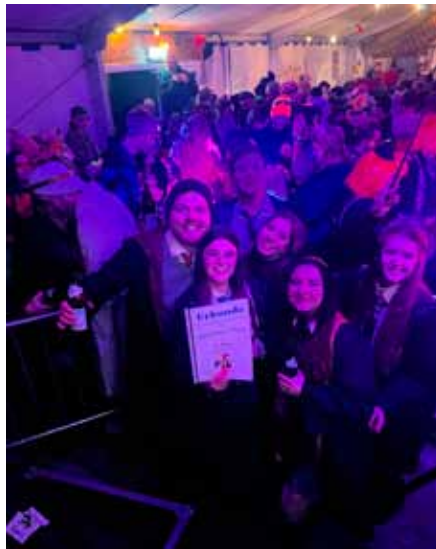
„Harry Potter“ - die Gewinnergruppe bei den Wägen aus Scheuring

Die Gewinner wurden dann im Partyzelt der Feuerwehr bekannt gegeben, in dem die Party schon im vollen Gange war. Auch in den anderen Lokalisationen wurde ausgiebig Fasching gefeiert.