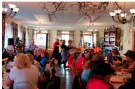
Einige schwangen zur temperamentvollen Musik das Tanzbein

und als Gstantzlänger brachte er die Senioren zum Lachen. Auch der Bürgermeister wurde von ihm mit einem Gstantz bedacht: „Der Trumpf ist ein