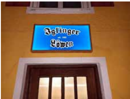
Der Eingang zum Löwenheim in Oberigling

Die Iglinger Löwen lieben Traditionen. Wie schon zum 30-jährigen Bestehen trafen sich die Mitglieder mit Freunden und Gönnern auch zum 40-Jährigen am Gründungstag, dem 4. Januar, im Vereinsheim, um zu feiern. An die 50 Löwenfans und Freunde kamen. Unter den Gästen