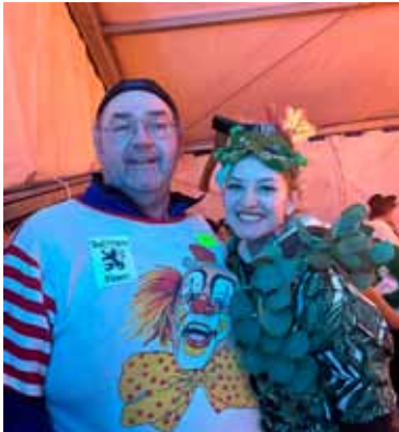
Gewinner der Fußgruppe „Energiedorf“