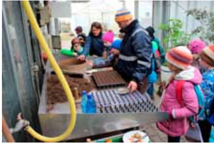
Die Kinder der 3b in der Gärtnerei von Regens Wagner

es leider schon wieder zurück in die Schule. Am nächsten Tag haben die Kinder im Unterricht dann 20 Quizfragen erstellt. Wer also wissen möchte, welche tollen Dinge die SchülerInnen der 3b auf dem Magnushof erfahren haben, muss einfach am 6. Mai auf das Jungpflanzenfest gehen und nach dem Quiz fragen. Vielen Dank an Frau Günzer und alle Angestellten für die tolle Führung über den Magnushof von Regens-Wagner.