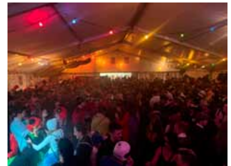
Das Partyzelt am Feuerwehrhaus war sehr gut besucht