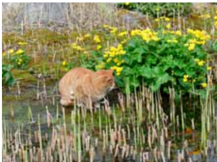
Katze und Goldfische am Oberiglinger Weiher / Foto: Gerhard Schurr