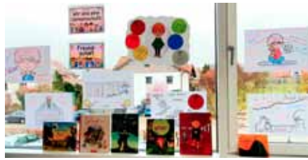
„Wir und Ich“ -Sozialecke 1a mit erarbeiteten Ergebnissen zum Thema Gefühle