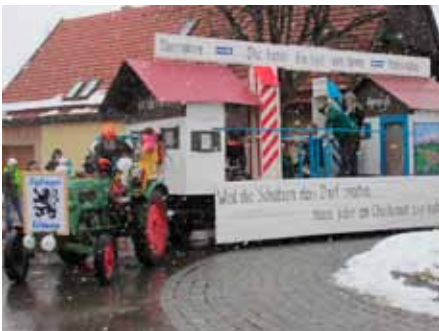
Mit der „Hohlen Gasse“ gewannen die Löwen 2012 beim Iglinger Faschingsumzug.

Beim entscheidenden Spiel um den Aufstieg in die Bundesliga in Meppen (1:0 für München) im Juni 1994 war