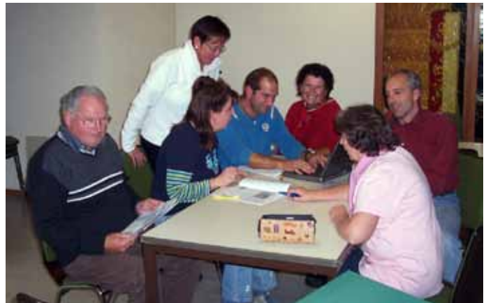
Die Dorfblatt-Redaktion 2008 im Feuerwehrhaus

löst. Wally Klaus leistet die Vorarbeit zur Abrechnung der Anzeigen; Frau Weber ist unsere Ansprechpartnerin in der Verwaltungsgemeinschaft Igling.