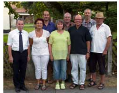
Die Dorfblatt-Redaktion 2013 in Holzhausen

Neben den Gemeindenachrichten, versorgen uns die Regens Wagner-Einrichtung, die Kindertagesstätte, die Grundschule an der Via Claudia, verschiedene Arbeitskreise, die Vereine und Organisationen, Handel und Gewerbe und Privatleute regelmäßig mit aktuellen Berichten und Fotos aus unserer Heimat, sowie mit gewerblichen und privaten Anzeigen. Wir hoffen auch weiterhin auf diese für uns wertvolle Mitarbeit, um als Nachrichtenbörse allen Mitbürgerinnen und Mitbürgern aus Igling und