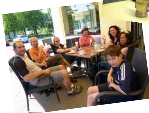
Impressionen von unseren Dorfblatt-Ausflügen