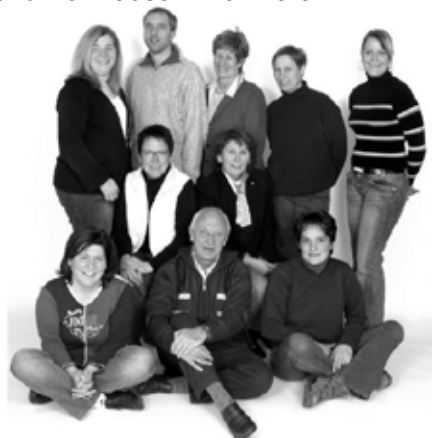
Das erste Redaktionsteam unseres 's Dorfblatts aus dem Jahr 2005