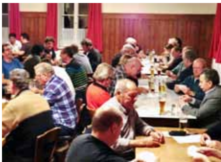
Die „Kartler“ beim konzentrierten Spiel im „Weißen Lamm“

So lädt das Dorfblatt zum Beispiel seit fünf Jahren zum Schafkopf-Turnier in den Gasthof „Weißes Lamm“ in Igling ein. In netter Atmosphäre, bei gekanntem Spiel und mit „guten Karten“ sind schöne Preise zu gewinnen.