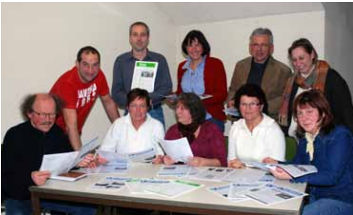
Die Dorfblatt-Redaktion ca. 2008 bei der Arbeit

dann nach typografischen Grundsätzen bearbeitet. Es gilt zum Beispiel „Schusterjungen“ und „Hurenkinder“ zu vermeiden (wen es interessiert, kann ja mal die Erklärungen unter Wikipedia nachlesen). Jedes Bild, das wir erhalten, wird auch in einem speziellen Programm bearbeitet, bevor es in der Ausgabe erscheint. Zuletzt werden dann auch noch die Gemeindepfeilern auf Seite 1 bis 4 eingebaut. Wenn diese Arbeitsschritte erledigt sind, wird die neue Ausgabe von unserem Korrektur-Team verbessert. Kurz vor dem Druck werden die Korrekturen eingearbeitet, und noch manches wird überarbeitet und verschoben. Die Druckausgabe wird dann in ein PDF umgewandelt und an die Druckerei gesendet. Dort wird innerhalb einer Woche die Ausgabe gedruckt, beschnitten, gefalzt und geheftet. Die Austräger - aber auch schon viele Leserinnen und Leser - warten zum Monatswechsel schon auf die druckfrische Ausgabe. Diese wird dann blitzschnell in Igling und