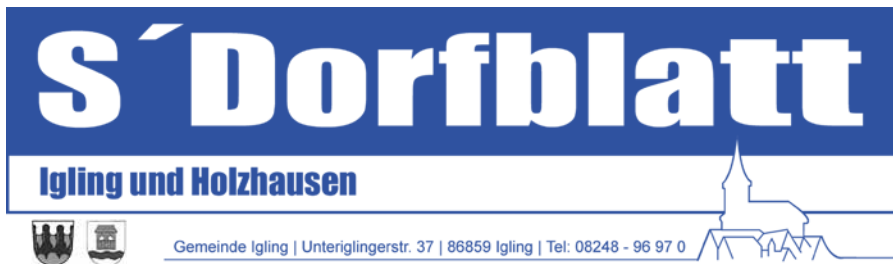
Ab 2005 - 2008 erschien das Dorfblatt mit dem blauen Logo, seitdem verwenden wir das neue Logo.

Mit unserem Termin-Service der monatlich wechselnden wichtigen Termine, verschiedenen Öffnungs-/Sprechzeiten und den Notrufnummern versorgen wir unsere Leser mit