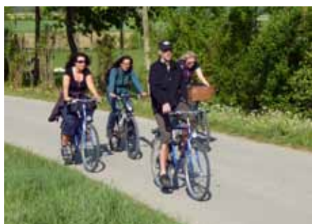
Mit dem Rad nach St. Ottilien

Wir radelten, wanderten oder kamen mit dem Auto zum Georgiberg bei Germaringen mit seiner romanischen Georgskirche, und erlebten auch