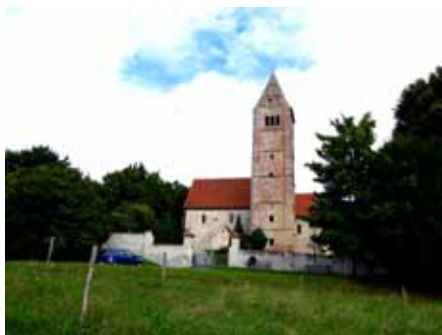
Die Georgskirche bei Germaringen

Zum Beispiel besichtigten wir mit Führung die Augsburger Allgemeine.