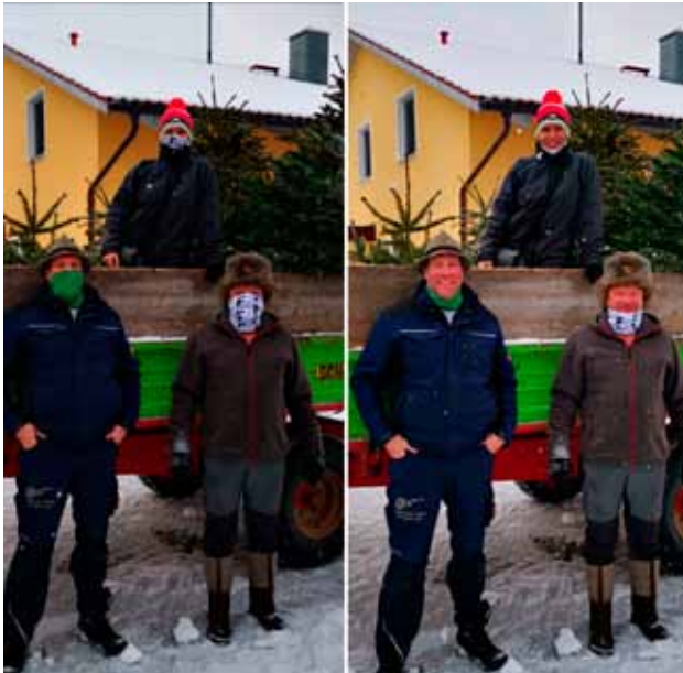
Das tatkräftige Team beim „Durchatmen“