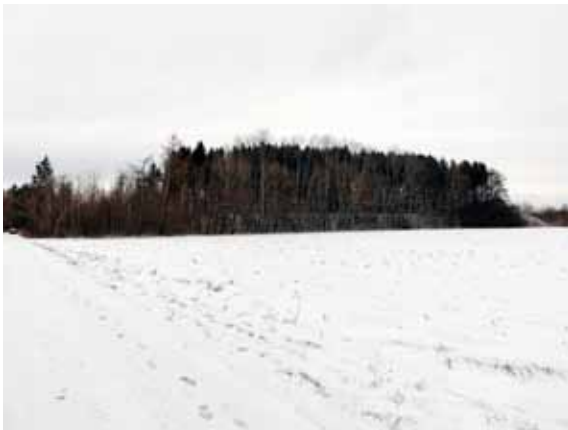
Gesamtansicht der Erdaufschüttung

Im Süden Diana II und im Norden Walnuß II. Der Abraum der Baufläche, zunächst Humus und Rotlage, wurden mit Kipploren, gezogen von kleinen Diesellokomotiven vom Bauplatz weg auf umliegende Grundstücke gefahren und dort zu einem Hügel aufgeschüttet. Es war geplant, die Erde später wieder auf dem Bunker zu verteilen und diesen dann zur Tarnung zu bepflanzen.