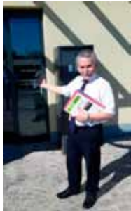
Bürgermeister Günter Först