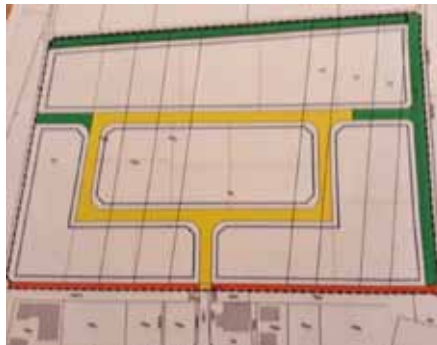
Ein erster Vorschlag für das neue Gewerbegebiet Igling

In der Januarsitzung 2021 hat der Gemeinderat die Weichen gestellt, um das Gewerbegebiet nach Norden erweitern zu können.