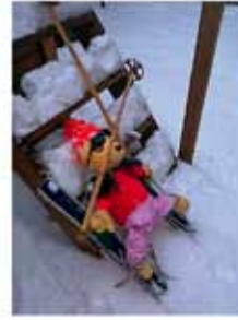
Wintersport mit Erdmännchen- (nicht) zum Nachmachen!