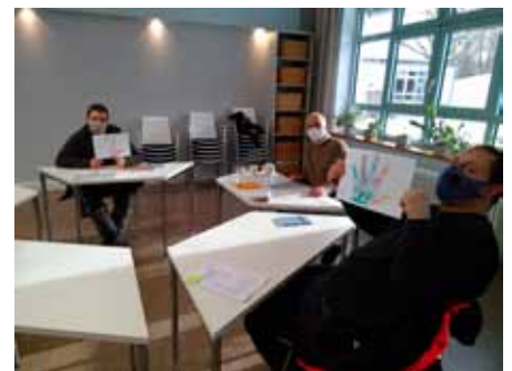
Impuls-Tag in den Magnus-Werkstätten: Das Thema „Hände“ wurde über Bilder und Texte sehr konkret

Ein Schwerpunkt der Betrachtung war den Händen gewidmet. Es wurde aufgezeigt, wie wertvoll und wunderbar wir damit umgehen können, wie viel Gutes wir mit unseren Händen im Alltag tun können. Sehr eindringlich spricht davon die Geschichte vom Land Kophthanien: Hier lernen Menschen am Beispiel anderer, wie wohltuend sie mit ihren Händen wirken können: Hände berühren, sie helfen, sie trösten, sie versöhnen, sie schenken Freude, Glück und Geborgenheit.