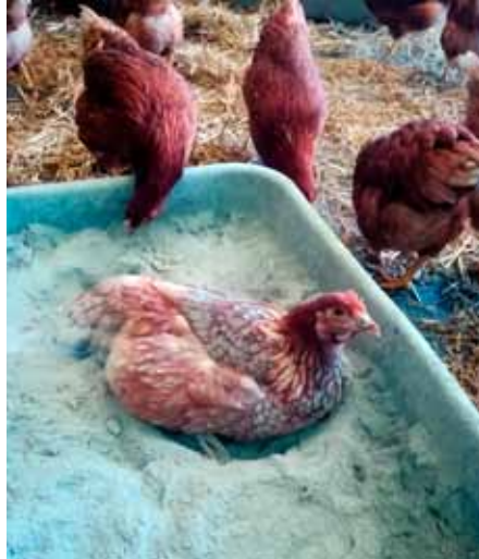
Huhn in der Badewanne: So ein Sandbad ist für das Huhn nicht nur die reine Wonne, es dient auch der Körperpflege!

liches Hausgeflügel Stallpflicht. Zum Glück hat unser Hühnerstall einen schönen, großen Wintergarten, der direkt an den Stall anschließt und den Tieren jederzeit zur Verfügung steht.