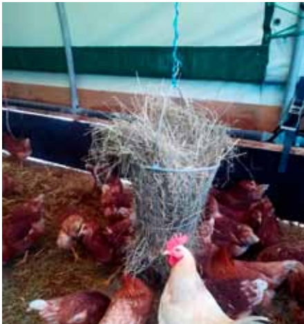
Im Wintergarten des Hühnerstalls: An der Heuraufe scharen sich eifrig pickende Hennen und ein aufmerksamer Gockel.

In Holzhausen, gleich gegenüber vom Hofladen, liegt der Hühnerstall der Regens Wagner Bioland-Landwirtschaft. Hier haben 740 Hennen und acht Gockel ihr Zuhause. Sie werden von den Beschäftigten unserer landwirtschaftlichen Werkstattgruppe versorgt. Zum Stall gehören zwei über 3000 Quadratmeter große Ausläufe, in denen Sie vielleicht schon einmal unsere Hühner entdeckt haben. Der eine ist von der Magnusstraße aus auf Höhe der alten Landwirtschaft einzusehen, der zweite liegt direkt linker Hand, wenn Sie am Kalkofenweg Richtung Iging zu einem Spaziergang aufbrechen.