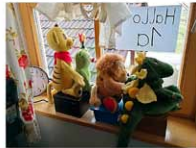
Die Hilfslehrkräfte warten auf meinem Fensterbrett im Büro auf vorbeikommende Fans aus der 1a

lichen Übungen, Liedern zum Mitsingen und Arbeitsformen jeder Art, soll dann das Pensum bis 11.00 Uhr bei den Kleinen und ca. 12.00 Uhr bei den Größeren erledigt werden.