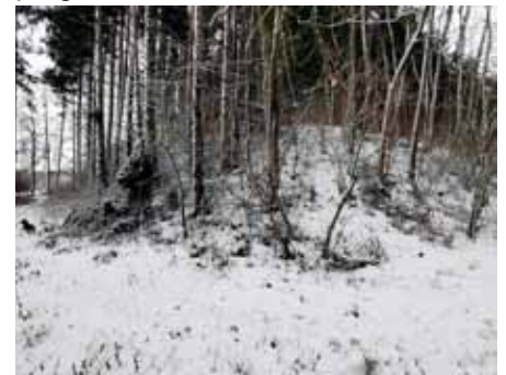
Südwestliche Ecke des Erdhaufens

Die Erde liegt immer noch auf unserer Wiese, die ich vor einigen Jahren aufgeforstet habe. So muss man schon genau hinschauen, damit man die Hinterlassenschaft dieser unseeligen Zeit entdeckt. Mich erinnert der Anblick immer wieder an ein sehr prägendes Kindheitserlebnis.