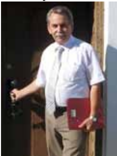
Bürgermeister Günther Först