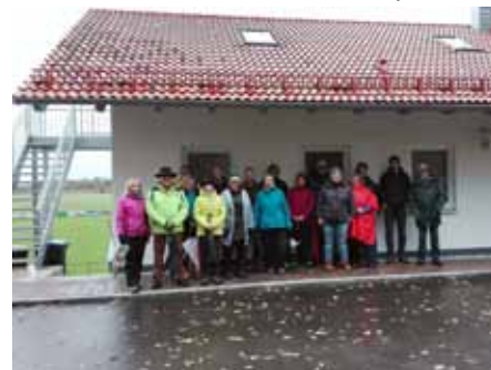
Abmarsch am Sportheim zur Dank-Wallfahrt

Zum Dank für das gute Gelingen der Neu- und Umbaumaßnahme des Sport- und Schützenheims wallfahrten die Verantwortlichen der Baumaßnahme zur Rindenkapelle.