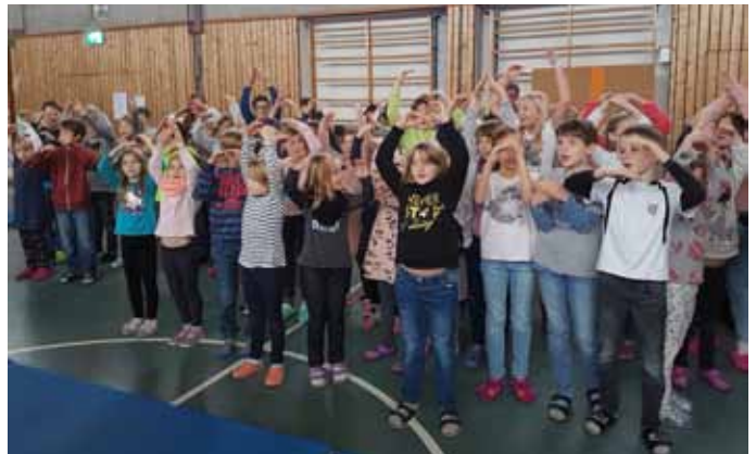
Begeistert feiern die Schulkinder die Einweihung der Offenen Ganztageschule