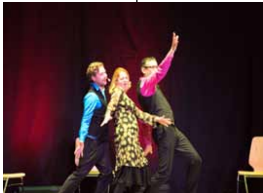
Brachte den Saal zum Lachen: das „Fast Food Theater“ München mit dem Programm „Best of Life“

Die intensiven Vorbereitungen und Proben für einen reibungsfreien Ablauf machten sich bezahlt: Mit so viel Professionalität hatten die Gäste nicht gerechnet. Die Bühne der Turnhalle macht ihrem Namen Kunstbühne alle Ehre. Vom Vorhang bis hin zur modernen Bühnentechnik ist für alles gesorgt, um den Darstellern einen professionellen Auftritt zu ermöglichen.