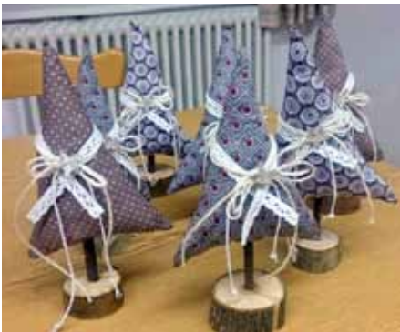
Tannenbäumchen für den Seniorenadvent

Eine schöne Tradition ist es geworden, dass sich die Kreativgruppe um