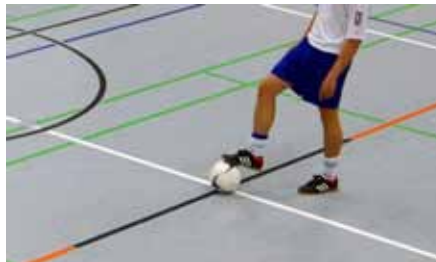
Ein Fußballturnier mit super Sportsgeist erwartet Sie am 24. Februar in Hurlach

Es wird wieder ein inklusives Turnier sein, bei dem Fußballer von Regens Wagner Holzhausen den zehn teilnehmenden AH-Mannschaften zugelost werden.