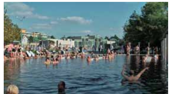
Außenbecken im ungarischen Kurort Hajdusoboszlo

vertrieben. In der Zwischenzeit hat Hans Bloos alles aufgebaut für seinen Reisebericht über Ungarn. Der Film führte uns in den ostungarischen Kurort Hajdusoboszlo, ca. 200 km östlich von Budapest. 1925 wurde dort 73 Grad warmes Thermalwasser gefunden. Dessen außerordentliche Heilkraft förderte die Entwicklung der Kurstadt. Auf 30 Hektar entstand ein herrliches Badeparadies für die ganze Familie. Mit wunderschönen Bildern und Einstellungen wurden uns die Schönheit und Geselligkeit der zweitgrößten Kurstadt Ungarns gezeigt.