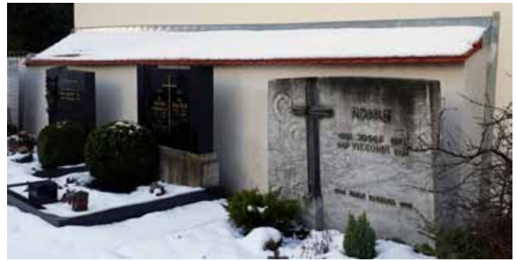
Die restlichen Arbeiten an der Unteriglinger Friedhofsmauer konnten im Jahr 2017 noch erledigt werden

Im letzten Jahr erhielt Bürgermeister Först einen Brief, den er an das Christ- kind weiterge- ben sollte, mit dem Wunsch: „Bitte mach die Friedhofs- mauer fertig“. Rechtzeitig zum Jahres- schluss 2017 hat sein immer