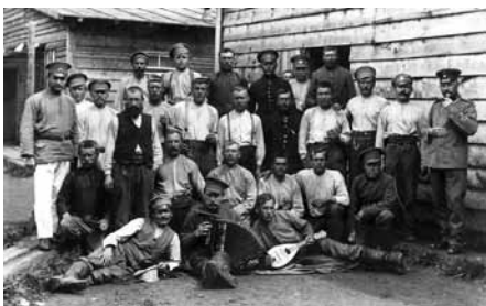
Kriegsgefangene aus Russland und Frankreich im Schloss