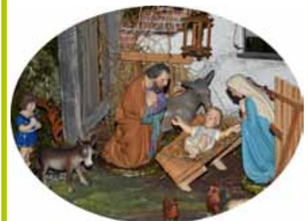
Die heilige Familie in der Krippe der Familie Trommer

Der Schützenverein Unterigling wünscht allen eine besinnliche Weihnachtszeit und ein gutes, neues Jahr 2018