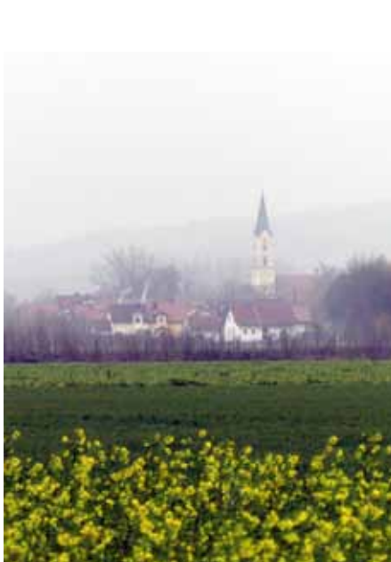
Die Unteriglinger Kirche im Nebel