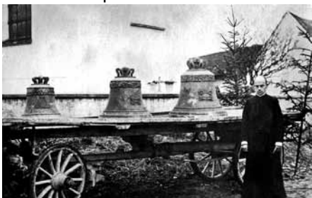
Pfarrer Johann Baptist Meindl vor der Abholung der Glocken am 13. November 1917

Am 13. November 1917 musste die Pfarrei Unterigling drei Glocken abliefern, nur die große Glocke durfte bleiben. Die Glocken wurden erst 1871 nach dem großen Dorfbrand am 3. Oktober 1869, dem auch der Kirchturm zum Opfer fiel und die Glocken