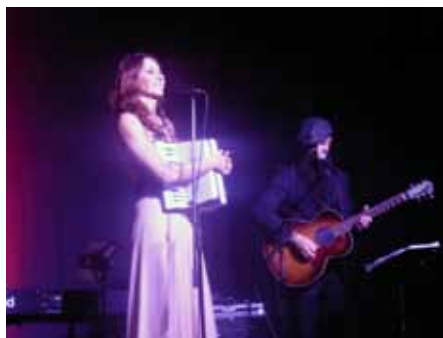
Musik zum Träumen und Genießen mit der brillanten Coverband „all about davenport“