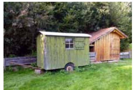
Holzmacherwagen heute

Seine Herkunft kann man durch das am Eingang angebrachte Schild „Stetten – Igling“ erkennen.