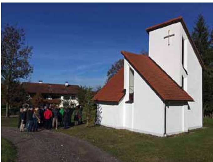
Die Kreszentia Kapelle in Deutenhausen ist Ziel des katholischen Frauenbundes.