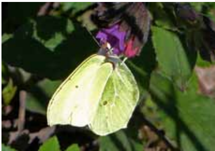
Der Zitronenfalter: einer der ersten Schmetterlinge im Garten und am Waldrand

Verbindliche Anmeldung beim Vorstand Gerhard Schurr Tel. 901952