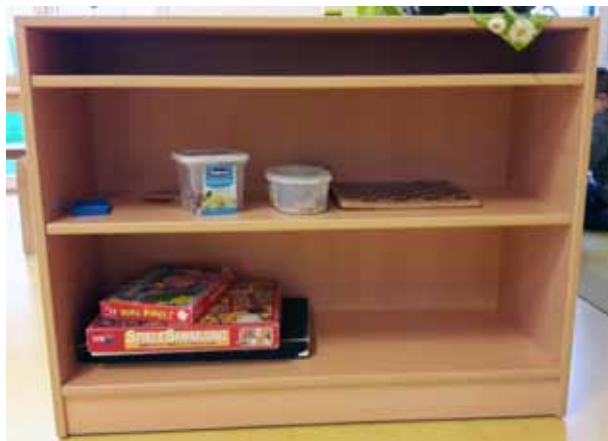
Leider war das Angebot an Spielen in der neuen OGTS eher übersichtlich