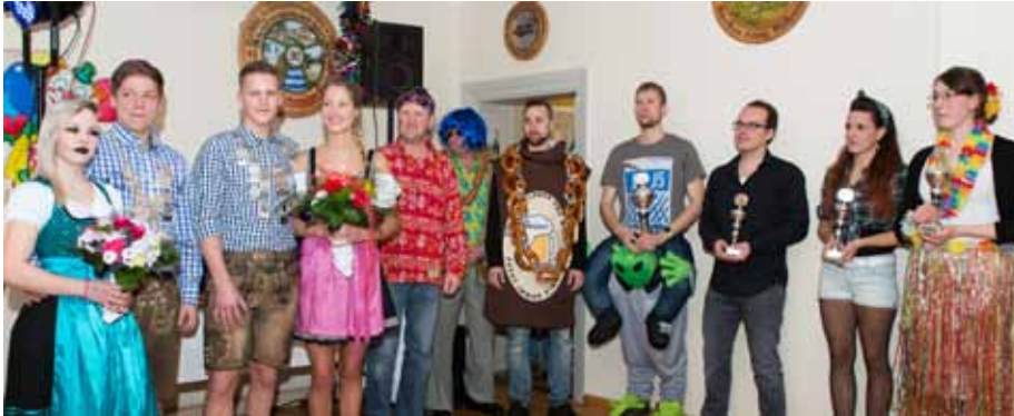
Die erfolgreichen Schützen nach der Proklamation.