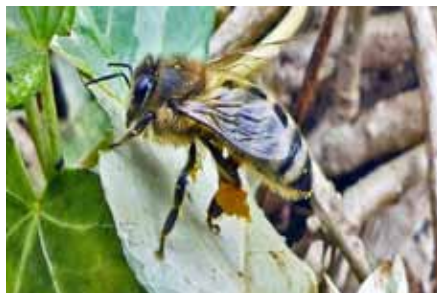
Wildbiene an einem Lungenkraut

Wenn alle Gartenbesitzer und Imker während der ganzen Wachstums-saison blühende Pflanzen in ihren Gärten hätten, stünde es sicherlich um die Ernährungslage von Bienen