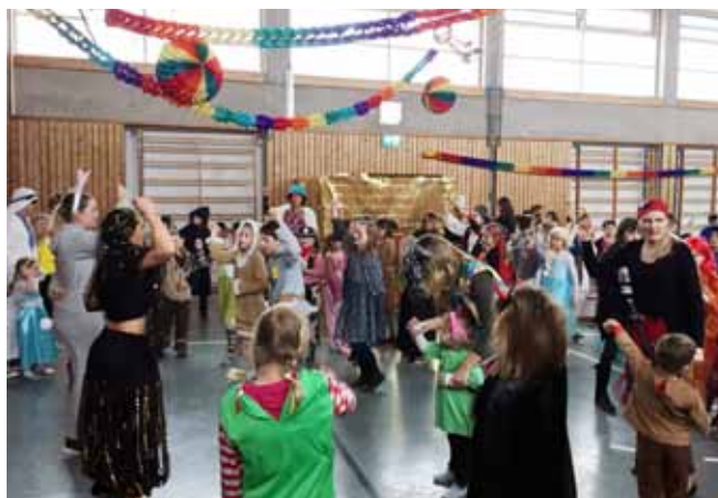
Die Turnhalle war bei beiden Faschingsbällen gut gefüllt und Kinder und Eltern hatten beim Kinderfasching ihren Spaß

von 12 bis 16 Jahren zur Faschingsdisco eingeladen. Hier sorgten drei DJ's mit ihrer professionellen Sound- und Lichanlage für ultimativen Partysound und -stimmung. Die Teenager kamen phantasievoll kostümiert und ließen sich mit einer