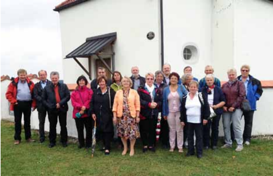
Die Jahrgänge 1951 - 1954 der Iglinger Schule vor der Heimsuchungskapelle