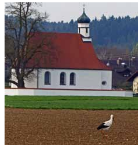
Ein Storch vor der Heimsuchungskapelle