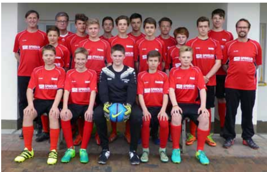
Die C-Jugend der Spielgemeinschaft Igling / Erpfting und ihre Trainer bedanken sich herzlich bei der Firma Spindler Bausträger und Immobilien GmbH, die für Mannschaft und Trainer Aufwärmshirts gesponsert hat.