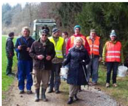
Die fleißigen Umweltsäuberer

Dieses Jahr beteiligten sich 14 freiwillige Helfer vom Schützenverein zusammen mit 8 Mitgliedern von den