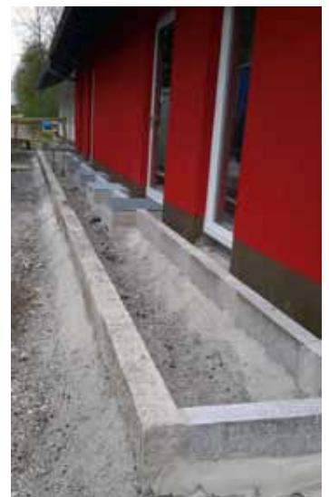
Pflasterarbeiten am neuen Sport- und Schützenheim

Wir hoffen, dass dadurch das Sport- und Schützenheim vor Überschwemmung, wie vor einigen Jahren geschehen, zukünftig verschont bleibt.