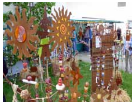
Am 12. Mai ist Hoffest mit Jungpflanzenverkauf bei Regens Wagner Holzhausen

Freundschaft ist eine Tür zwischen zwei Menschen. Sie kann knarren, sie kann manchmal klemmen, aber sie ist nie verschlossen.