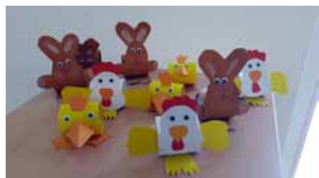
Toller Osterschmuck entstand bei den Bastelarbeiten

auch die Jungs waren eifrig dabei und haben sehr schönen Osterschmuck gebastelt, den sie am Donnerstag stolz mit nach Hause nahmen.